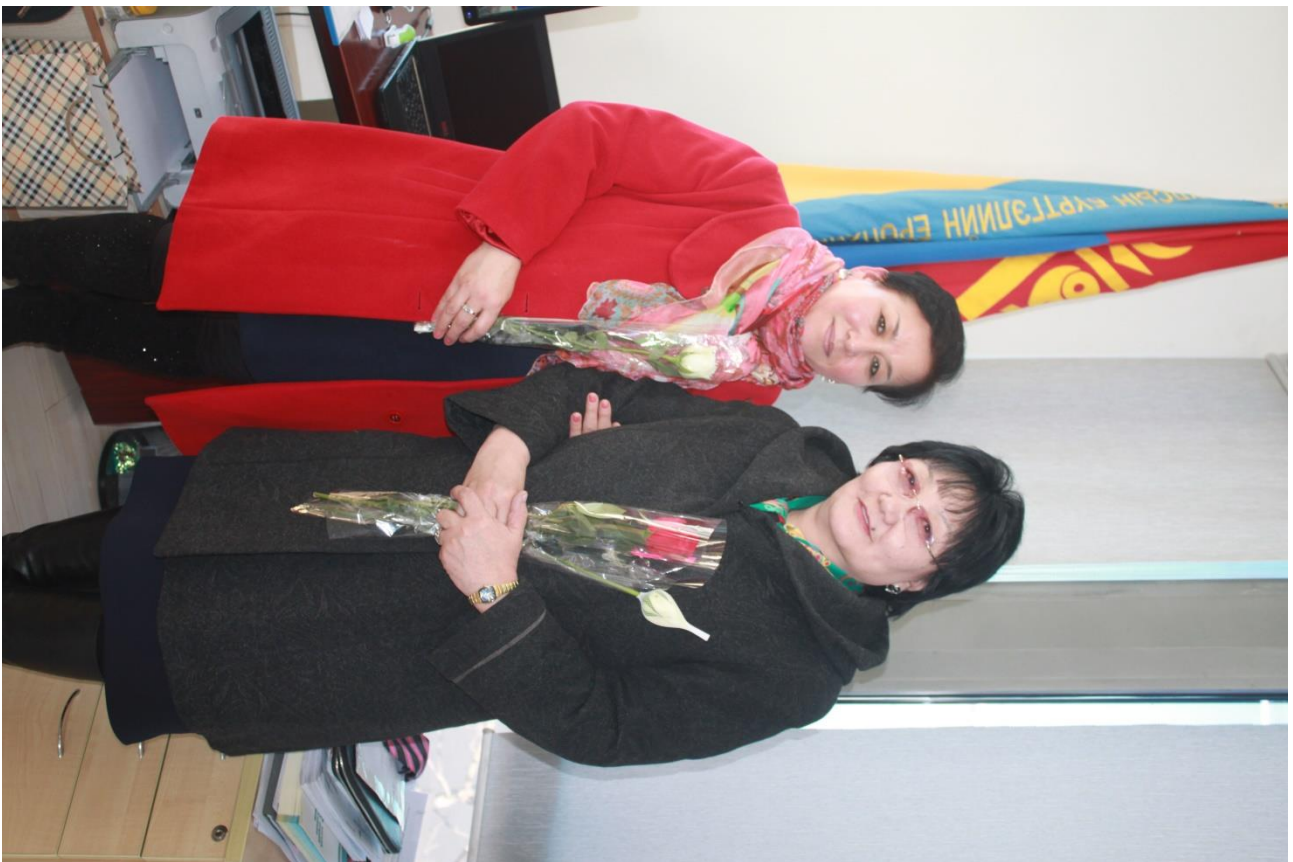
УЛСЫН БҮРТГЭЛИЙН ХЭЛТЭС